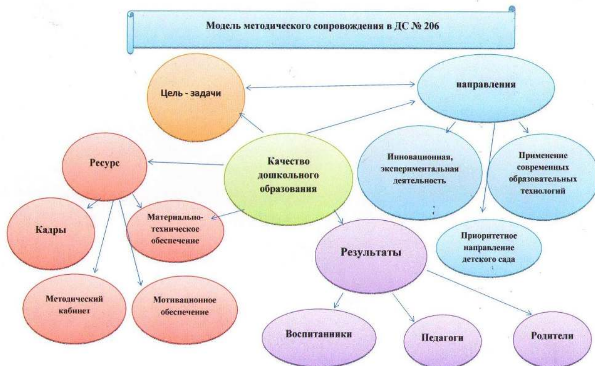
Рисунок 3. Модель методического сопровождения в детском саду № 206

Важным фактором повышения профессионального уровня педагогов является самообразование. Направление и содержание самообразования определяется самим воспитателем в соответствии с его потребностями и интересами. В 2023 году повышение квалификации педагогов проходило в дистанционном формате и очном формате с использованием современных образовательных ресурсов и образовательных платформ, что позволило вести систематическую непрерывную работу по повышению профессионального уровня педагогов. Высокий уровень квалификации педагогического коллектива позволяет решать задачи воспитания и развития каждого ребенка и подтверждается представлением профессионального опыта педагогов детского сада на разных уровнях.